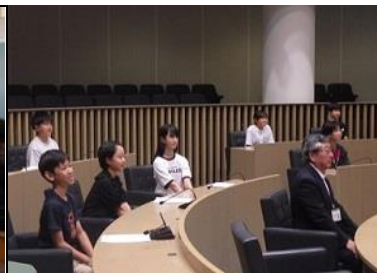
7/18上里町長との意見交換会