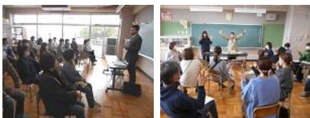
<6年生保護者 親の学習会に参加>