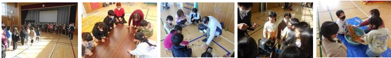
<学校応援団の方々による1年生昔遊び>

日々の教育活動の中で、児童は伸び伸びと成長しています。 地域の皆さんありがとうございます。😊