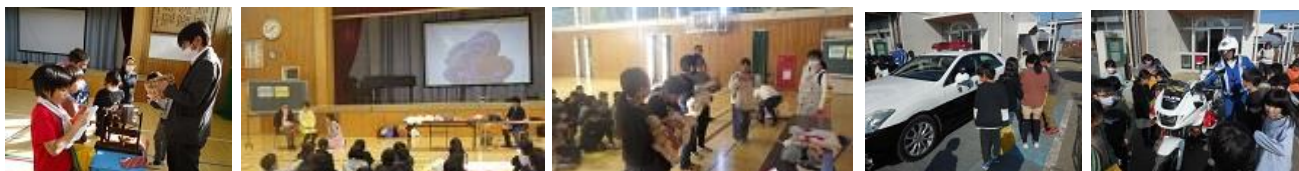
<助産師さんによる命の授業>