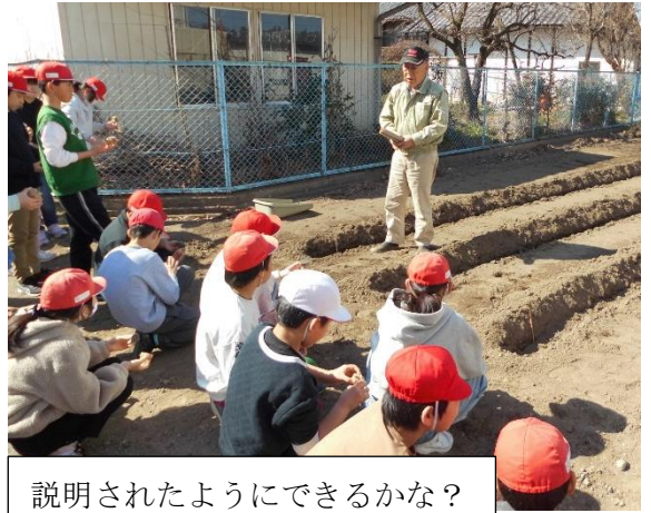
説明されたようにできるかな？