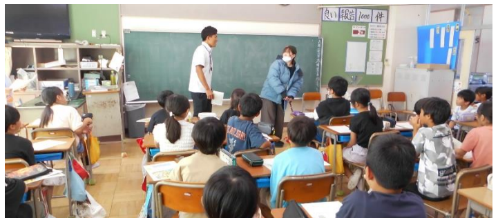
認知症の人への対応を学級担任と介助員の寸劇から学ぶ

超高齢社会を突き進む日本にとって、認知症の問題は避けて通ることはできないでしょう。認知症に対する正しい理解と思いやりのある対応が求められます。