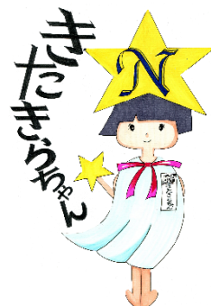
上里北中学校キャラクター

9月26日の全校朝会で、生徒に3つの話をしました。一つ目は部活動。9月20日に美里遺跡の森総合グラウンドで行われた陸上部の新人戦。印象的だったのは、持てる力を出し切って、ラストスパートをしていた選手の姿です。最後まであきらめず全力を出し切る姿勢に心を打たれました。9月23日にワープ上里で開催された吹奏楽部定期演奏会、大成功でした。練習の成果を存分に発揮し、一人一人の努力と熱意のある演奏により、来場された方々の心の中で素晴らしい思い出となりました。二つ目は生徒会選挙。この選挙に力いっぱい取り組んで、この機会を大切にしてほしいと話しました。三つ目は、さらに自慢のできる上里北中学校にすることについてです。生徒の皆さん一人一人が在籍していることが自慢だと話しました。さらに自慢のできる上里北中学校にするには、生徒の皆さん一人一人の力も必要です。地域の方々に対して、進んであいさつすることに、ぜひチャレンジしてほしいと願っています。