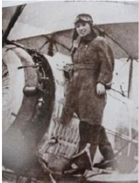
郷土（上里町）の偉人 西崎キク (1912年11月2日～1979年10月6日)