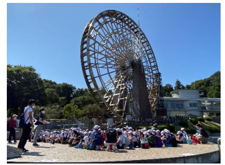
社会科見学 川の博物館（3年）