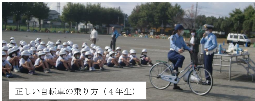
正しい自転車の乗り方（4年生）

埼玉県内では、3分間に1件の交通事故（人身・物損）が起きているとのこと。また、昨年度の交通事故死亡者数は129名で、全国で8番目に多い県となっています。死亡事故の原因は、その約半数が「脇見運転」で起きているそうです。何か考え事をしていて、カーナビを操作している等、ちょっとしたことが死亡事故につながっています。