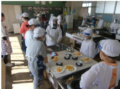
感染対策をしての調理実習（5年）

につなげていきたいと思えます。地域・保護者の皆様に参観していただきたいという点については、いろいろと制約がついてしましますが、今後も感染状況を見守りながら、実施方法等を検討していきたいと考えております。引き続き御理解・御協力をよろしくお願いいたします。