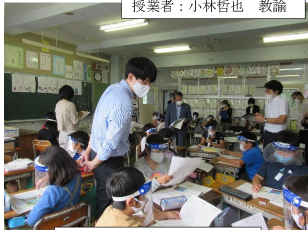
グループでの学び合いの様子

上記の言葉は教育の場でよく語られるものです。学校生活の多くの時間を授業が占めるわけですから、授業で子供たちのよさや可能性を引き出し、伸ばしていく力が求められます。そのために、自分の授業を公開し、他の教職員や指導者に参観してもらい、協議することで授業改善を目指していきます。