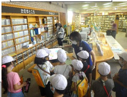
町立図書館見学（2年）