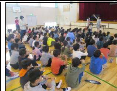
3年生リコーダー講習会