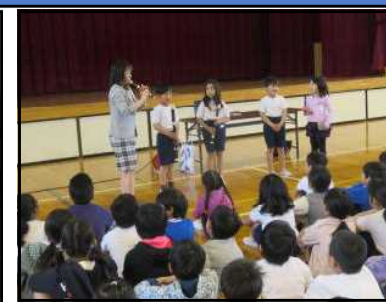
3年生リコーダー講習会