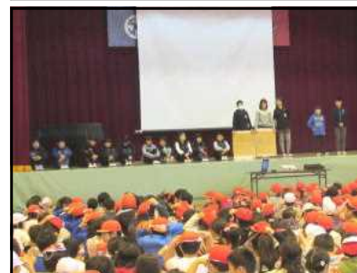
児童朝会（給食委員会）