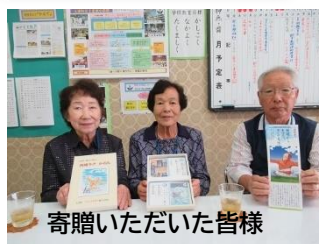
寄贈いただいた皆様

い意志で歩み続けたひとりの女性の姿を忘れないでください」と書かれています。男女共同参画の先駆者でもある、上里町の偉人の子供たちには誇りに思っていて欲しいと思います。準備ができ次第、掲示したいと思います。ありがとうございました。