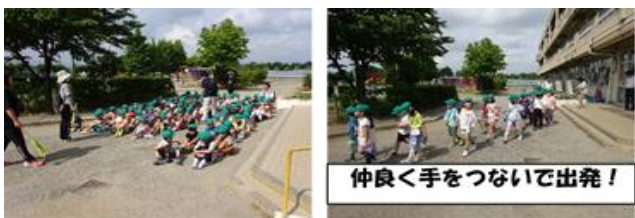
仲良く手をつないで出発!