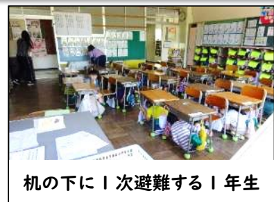
机の下に | 次避難する | 1年生

最近大きな地震が起きています。首都圏直下の巨大地震がいつ起こるかかわかりません。起これば