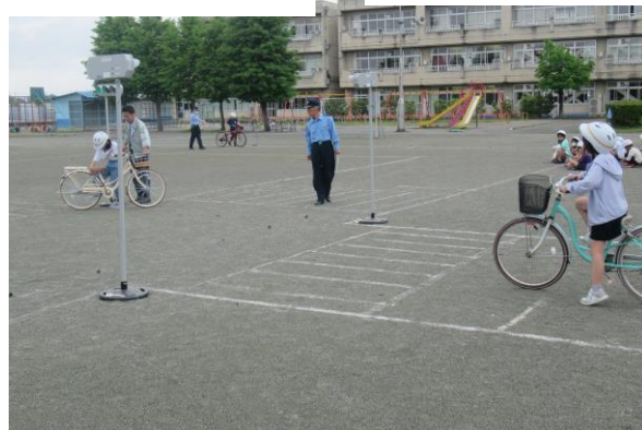
《交通安全教室の様子》