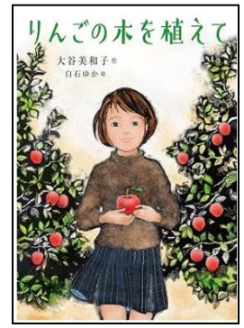
りんごの木を植えて