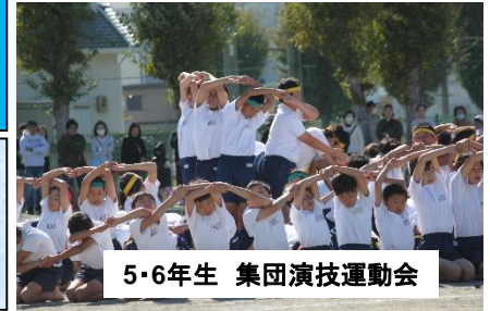
5・6年生 集団演技運動会

学校評価の実施 ・学校運営協議会 ・学校評価の公表 ・保護者アンケート ・学校関係者評価