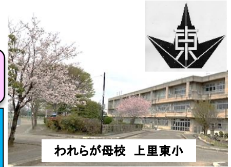
われらが母校 上里東小