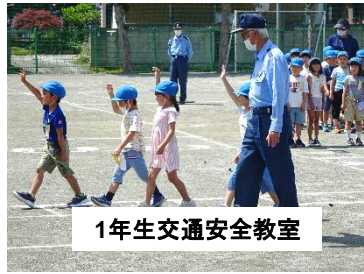
1年生交通安全教室