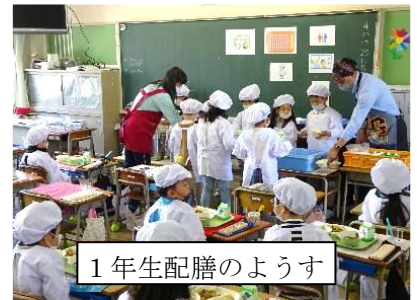
1年生配膳のようす

2年生から6年生は12日から、1年生は17日から給食が始まりました。1年生は初めての給食。担任の先生方にお手伝いしていただきました。食事は前を向いて静かに給食を食べていました。今はどの学年も給食は前を向いて静かに食べています。だんだんグループで楽しく会食ができるようになっていくといいですね。