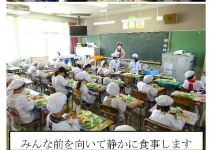
みんな前を向いて静かに食事します