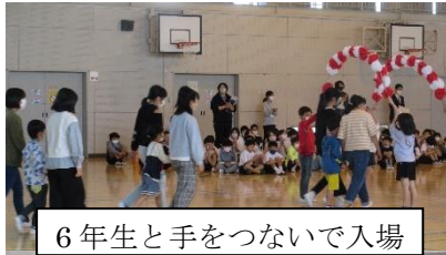
6年生と手をつないで入場

6年生に手を引かれて入場した1年生の首には、5年生が作り6年生がメッセージを書いたメダルがかけられて