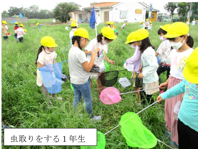
虫取りをする1年生

1年生は、学校南側の畑を使わせていただき、虫取りを行いました。これは、生活科の学習です。草むらで虫を探して、虫たちの特徴や生活する場所について気付くことができるようにすることが学習のねらいとなります。草むらに入って生きた虫を捕まえることは、「本物とのふれあい」や「自然とのふれあい」、友達と協力することで「人とのふれあい」につながるものと考えます。