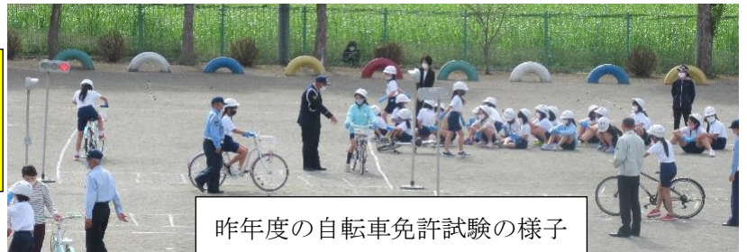
昨年度の自転車免許試験の様子