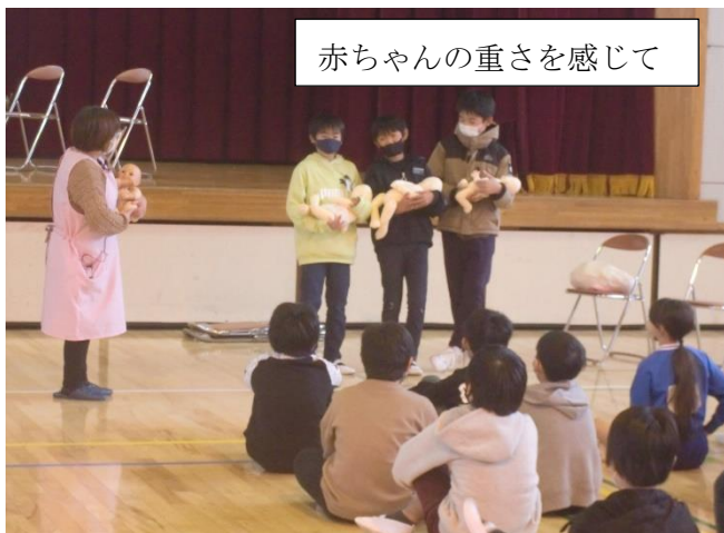
赤ちゃんの重さを感じて

11月24日、愛知県の中学校で中学3年生の男子生徒が同級生を包丁で刺して死亡させるという大変痛ましい事件が起きてしまいました。事件の動機や背景等については、今後明らかにされていくことと思いますが、何よりも大切にされなければならない尊い命が失われてしまったことは残念でなりません。11月26日には臨時全校朝会（放送）で命の大切について話をしました。何か事件等が起きてからではなく、年間をとおして計画的に命の大切を繰り返し子供たちに伝えていかなければならないと反省しております。