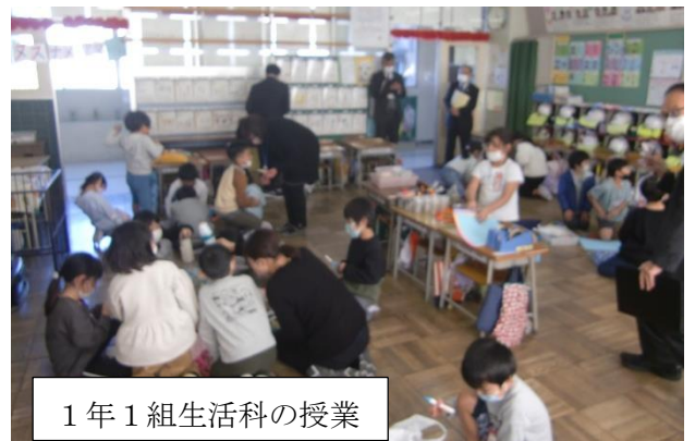
1年1組生活科の授業