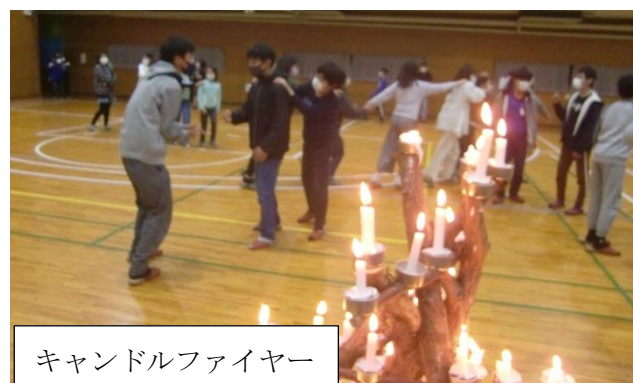
キャンドルファイヤー