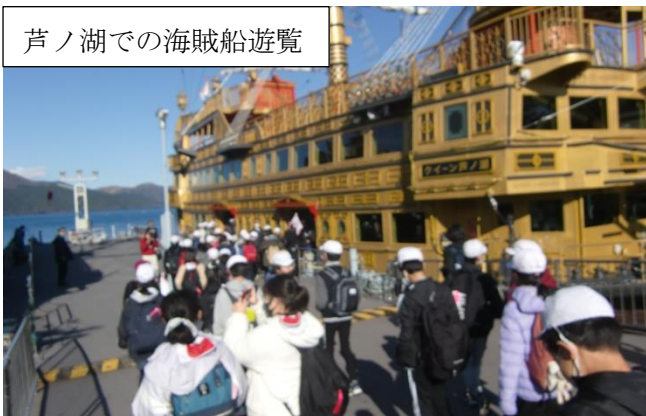
芦ノ湖での海賊船遊覧