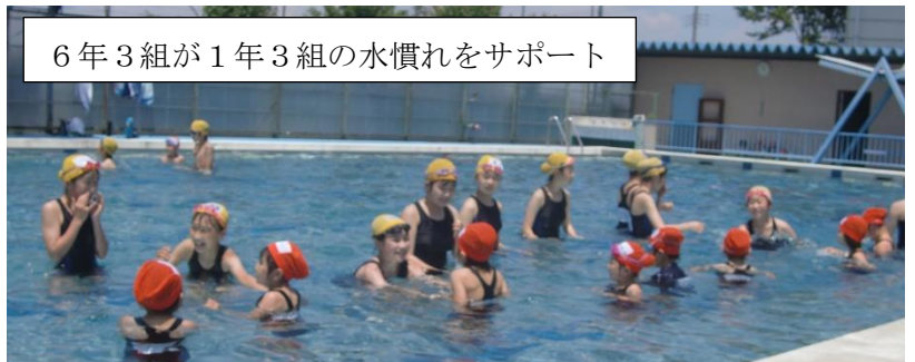
6年3組が1年3組の水慣れをサポート

6月11日（金）に学年ごとのプール開きを行い、水泳学習がスタートしました。昨年度は水泳学習ができませんでしたので、2年ぶりとなります。コロナ感染防止も図りながらの水泳学習となります。水泳で心肺機能を高めます。