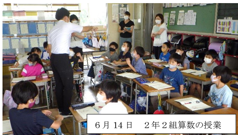
6月14日 2年2組算数の授業