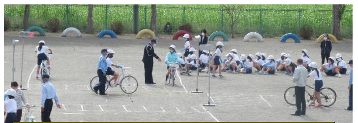
自転車免許講習4年 5月11日に実施予定 交通安全教室1年 5月10日に実施予定