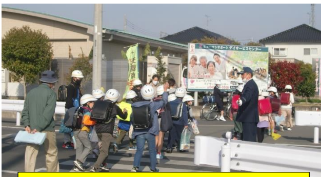
登下校の見守り ありがとうございます。

子供たちが、朝、元気に家を出て、安全に登校し、安全に学校生活を送り、安全に家に帰る。当たり前のことですが、このことが何より大事なことであり、学校が家庭や地域と連携して実現していかなければならないものと考えています。学力や体力を付けさせることももちろん大切なことですが、心身ともに健康で、安全が確保されていなければ、何も始まりません。家庭や地域の理解や協力がなければ成し遂げられないことでもあります。どうぞよろしくお願いいたします。