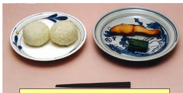
最初の学校給食（明治22年） おにぎり・塩鮭・菜の漬物

子供たちの食生活を取り巻く環境が大きく変化し、偏った栄養摂取、肥満傾向など健康状態について懸念される点が多く見られる今日、学校給食は、子供たちが食に関する正しい知識と望ましい食習慣を身に付けるために重要な役割を果たしています。